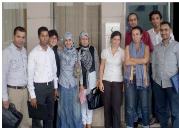
Formation de formateurs Rabat sept 2011

Marion ALLET , PlaNet Finance mallet@planetfinance.org