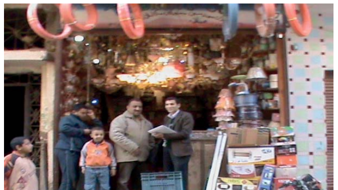
Distributeurs à Sahil Seleem

108 magasins de distribution, de toute taille, ont été rencontrés (86 à Dakahlia et 22 à Assiut), de la vente d'équipements de climatisation et d'électricité à la distribution de produits d'électricité proposés dans les quartiers couverts par ces activités.